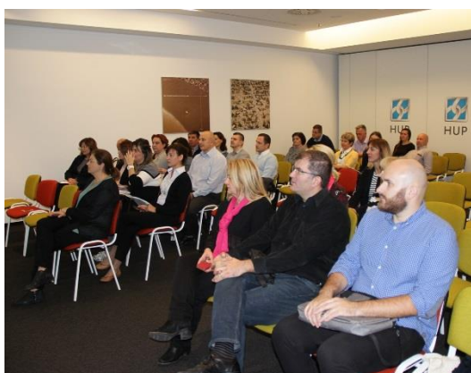
Horvātijas nacionālā skillME konference 2017.gada 29.septembrī, Zagrebā (Horvātija)

Projekta partneri visās dalībvalstīs organizēja arī nacionālās konferences , lai prezentētu projekta rezultātus un sasniegto ieinteresētajām pusēm. Konferenču izraisīja lielu interesi, un tās apmeklēja liels skaits uzņēmēju, kuri ir ieinteresēti savu darbinieku apmācībā, profesionālās izglītības iestāžu pārstāvji, kas ir ieinteresētas audzēkņu apmācību ieviešanā, kā arī citi interesenti.