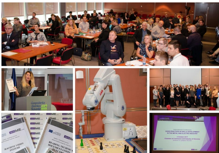
Starptautiskā skillME konference 2017.gada 4.oktobrī Ļubļanā, Slovēnijā.

Konferences mērķis bija prezentēt labas prakses un inovatīvas pieejas prasmju trūkuma novēršanā, pielīdzinot iegūstamās prasmes darba tirgus prasībām, attīstot jaunas prasmes jaunai nodarbinātībai un pielāgojot nacionālās stratēģijas, lai uzlabotu profesionālās izglītības un apmācību kvalitāti un efektivitāti un paaugstinātu darbinieku konkurentspēju. Tika prezentētas dažādas pieejas profesionālās izglītības stiprināšanā un izstrādāto mācību programmu ieviešanas nacionālās stratēģijas skillME projekta dalībvalstīs – Slovēnijā, Slovākijā, Latvijā un Horvātijā. Papildus tam pasniedzēji un audzēkņi pastāstīja par savu pieredzi pilotapmācību ieviešanas laikā un demonstrēja apmācību piemērojamību un rezultātus, balstoties uz Tehniskās redzes apmācību programmu – kameru pielietošana robotu vadībai, ko prezentēja audzēkņi no Stará Turá Tehniskās vidusskolas. Vairāk informācijas par konferenci projekta mājas lapā .